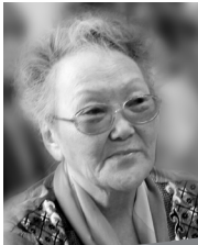
Автор текстов и перевода Ульяна ТАРАБУКИНА