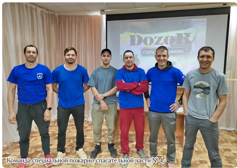
Команда специальной пожарно-спасательной части № 4

– Алла Сергеевна, такого формата соревнования это азарт, поиск, приключения. Поделитесь своими впечатлениями об игре.