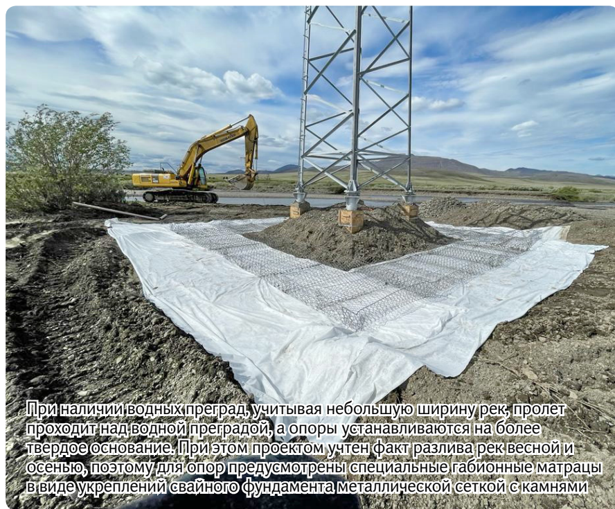
При наличии водных преград, учитывая небольшую ширину рек, пролет проходит над водной преградой, а опоры устанавливаются на более твердое основание. При этом проектом учтен факт разлива рек весной и осенью, поэтому для опор предусмотрены специальные габионные матрацы в виде укреплений свайного фундамента металлической сеткой с камнями