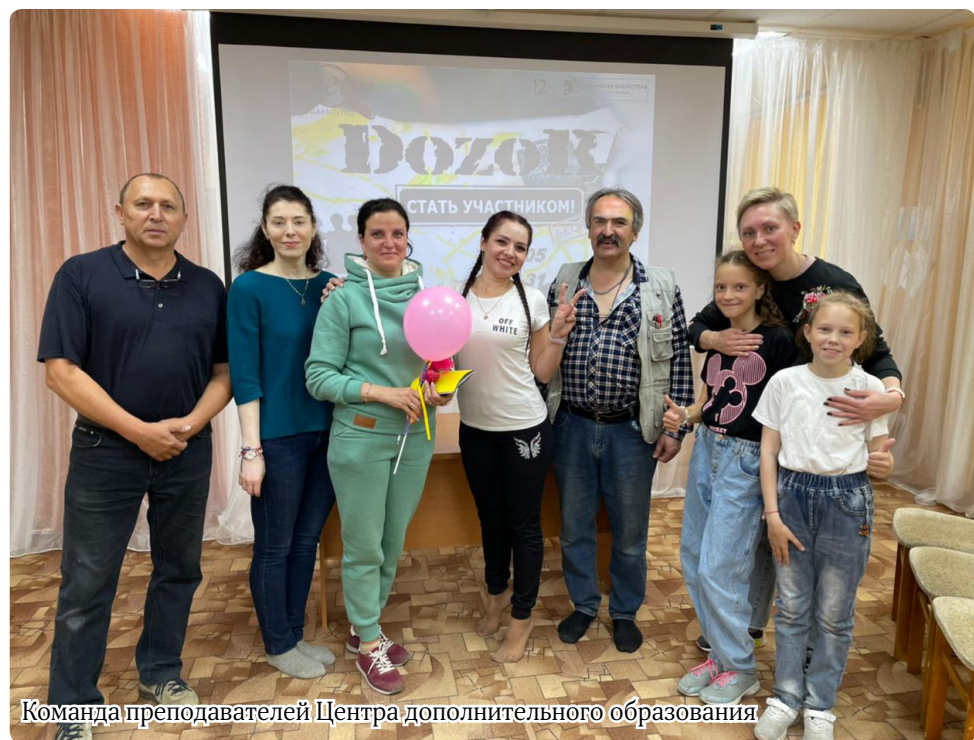
Команда преподавателей Центра дополнительного образования

– Квест «Дозор по-чукотски» приурочен к Году культурного наследия народов России и празднованию Дня города. Поддержку в игре городского масштаба оказали Отдел культуры, спорта и молодежной политики УСП администрации Билибинского муниципального района, профсоюз Билибинской АЭС. Благодарим всех за игру и поддержку!