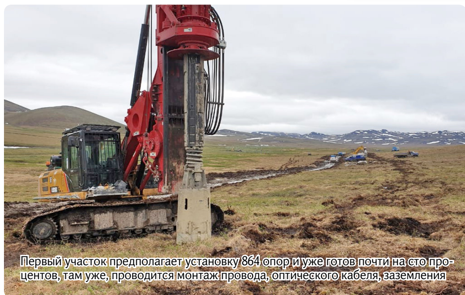
Первый участок предполагает установку 864 опор и уже готов почти на сто процентов, там уже, проводится монтаж провода, оптического кабеля, заземления

целом характеризуется обводненным грунтом, так и по Анюйскому нагорью, где преодолеваются уже совсем другие сложности: скальные основания, перепады высот. Всё это требует применять специальные технические решения прямо по ходу строительства, но благодаря квалифицированным и опытным кадрам, эти задачи решаются.