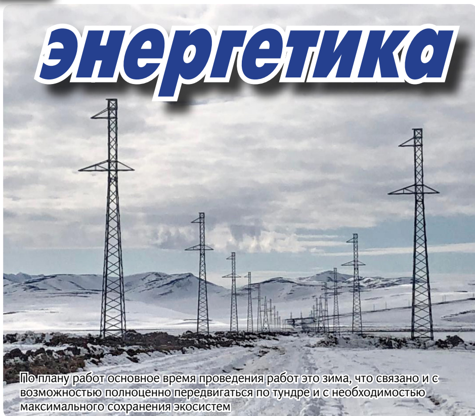
По плану работ основное время проведения работ это зима, что связано и с возможностью полноценно передвигаться по тундре и с необходимостью максимального сохранения экосистем