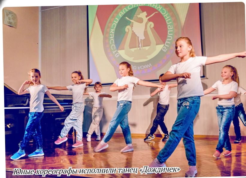
Юные хореографы исполнили танец «Дождичек»

Если только захотите, Попросите ваших мам – Сегодня, завтра, послезавтра Приходите в школу к нам! Здесь меж сказочных мелодий, Звонких нот и умных книг Живет славный «БШИшка» – Превосходный ученик! Вы о нашем приглашении Постарайтесь не забыть. Мы желаем вам, ребята, Вечно с музыкой дружить!