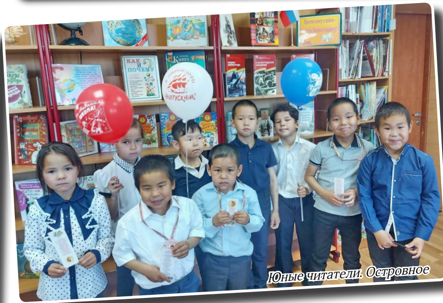
Юные читатели. Островное