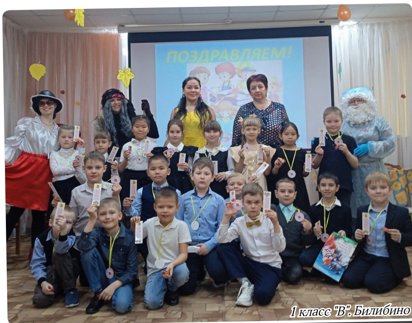
1 класс "В". Билибино

В октябре традиционные праздники «Посвящение в читатели» пройдут в Кеппеве, Анюйске и Илринее.