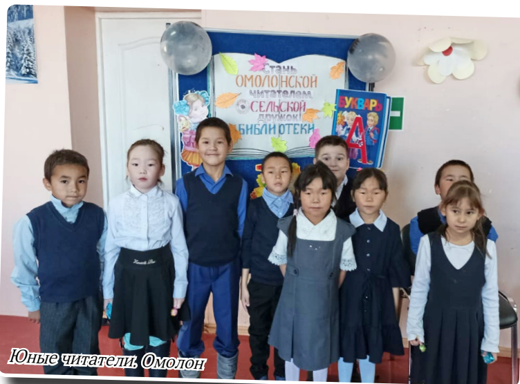
Юные читатели. Омолон