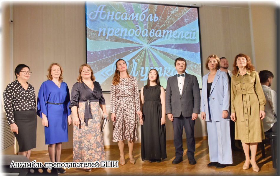
Ансамбль преподавателей БШИ