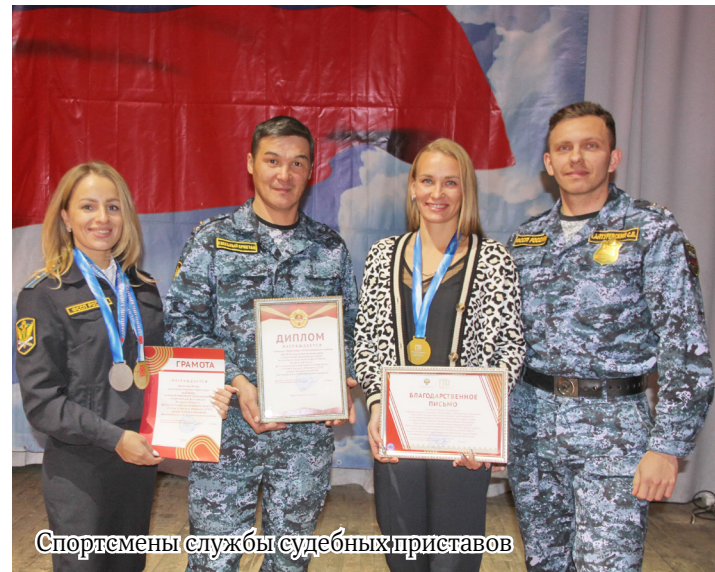
Спорсмены службы судебных приставов

шесть учреждений и организаций Билибинского района в числе которых встали на старт войсковые части 3537 и 46179-Б, отдел Управления Федеральной службы судебных приставов по Камчатскому краю и Чукотскому автономному округу, Межмуниципальный отдел МВД России «Билибинский», Специальная пожарно-спасательная часть МЧС России № 4. Неслучайно и значимо отдельным силовым ведомством представила Концерн «Росэнергоатом» Билибинская АЭС.