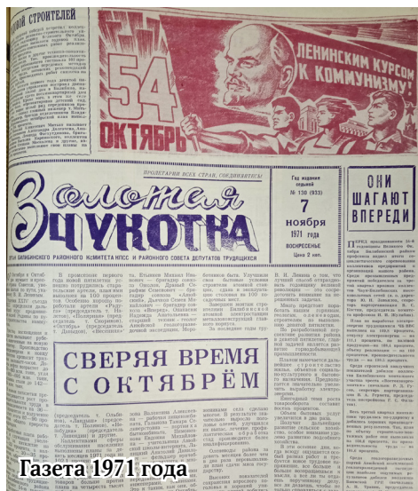
Газета 1971 года

1966 «За прошедшую семилетку наш район из сельскохозяйственного превращён в промышленный. В канун Октябрьской годовщины организован новый прииск. Год назад Совет Министров СССР принял решение о строительстве первой заполярной атомной станции. Горняки района ещё 6 сентября выполнили годовой план по добыче золота».