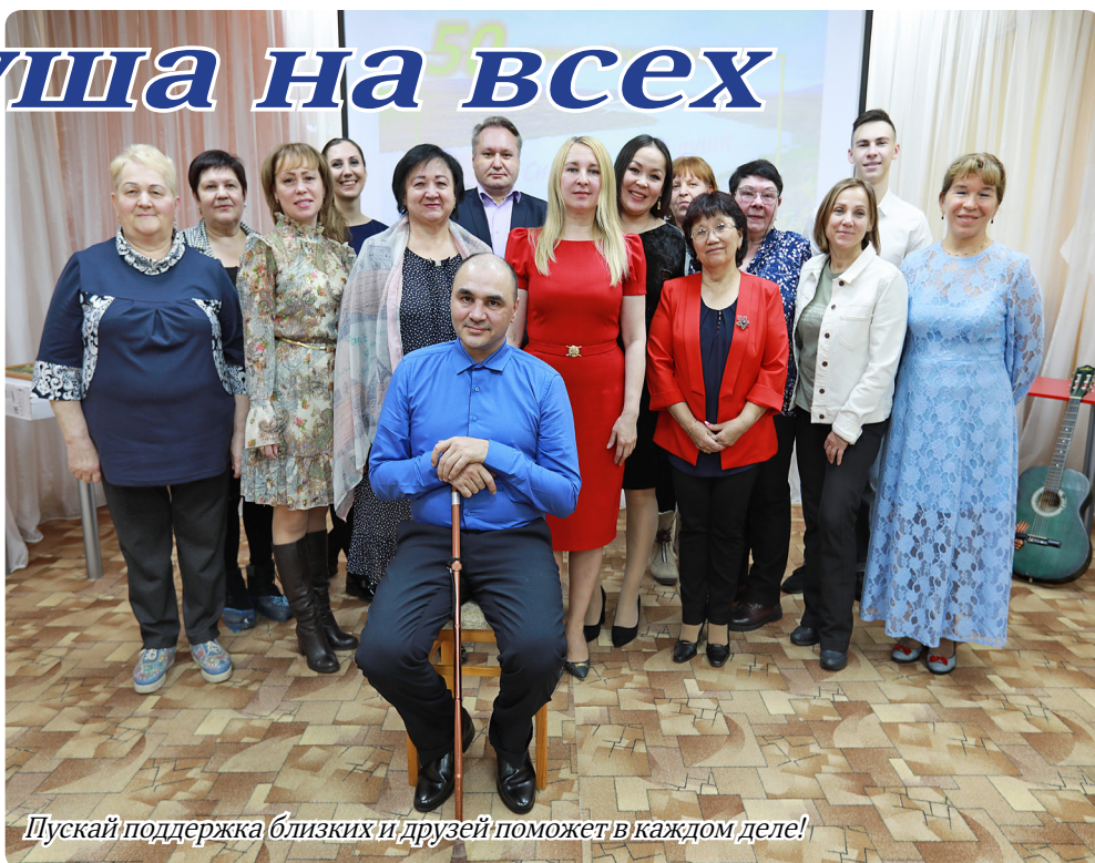
Пусть поддержка близких и друзей поможет в каждом деле!

«Я посвящаю свои стихи людям, но не тем, которые живут сейчас, а тем кто остался в прошлом».