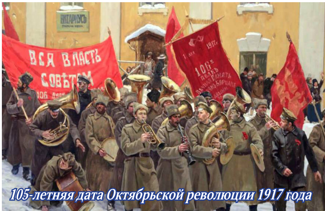
105-летняя дата Октябрьской революции 1917 года

1971 «Растёт и благоустраивается наш будущий заполярный город Билибино. В предпраздничные дни справили новоселье строители атомной электростанции – сдан в эксплуатацию дом гостиничного типа. Получили новое общежитие-интернат дети оленеводов. Горняки района получили квартиры в Мандриково и на Встречном».