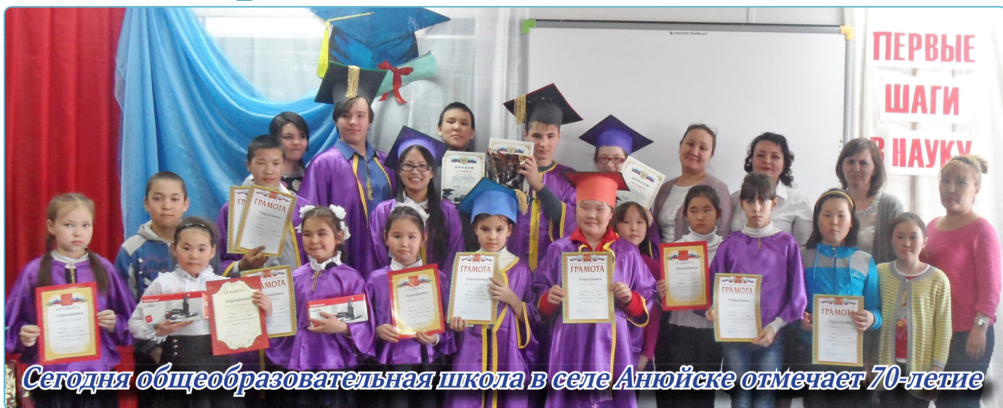
Сегодня общеобразовательная школа в селе Анюйске отмечает 70-летие