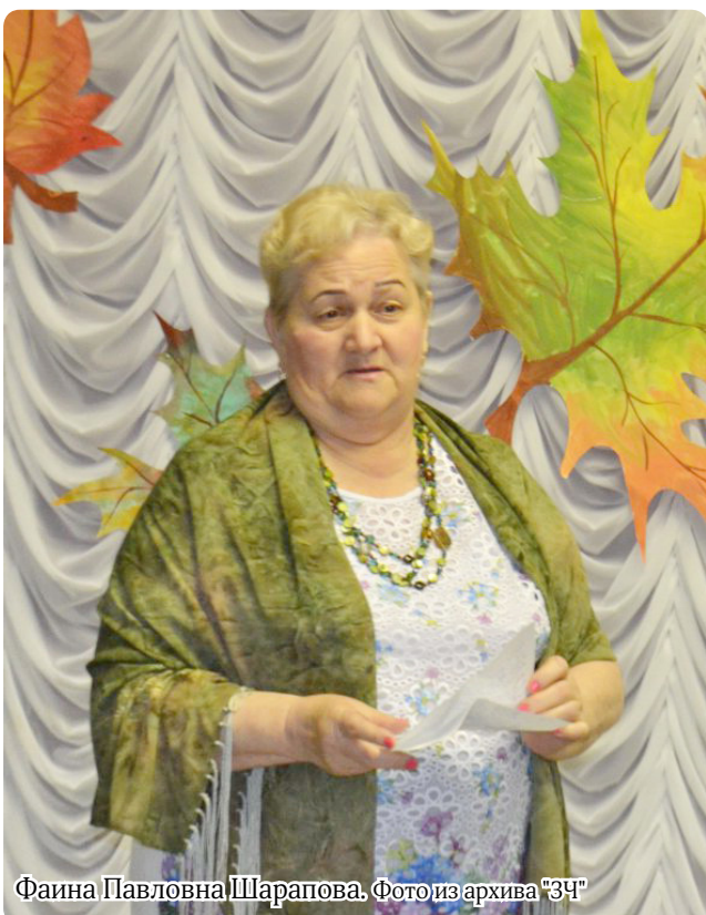
Фаина Павловна Шаропова.

АППАРАТ ГУБЕРНАТОРА И ПРАВИТЕЛЬСТВА ЧУКОТСКОГО АВТОНОМНОГО ОКРУГА