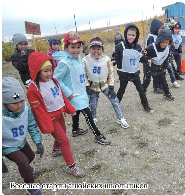
Веселые старты анойских школьников

нашем доме всегда было светло, уютно и тепло от добрых улыбок, дружеской поддержки и взаимопонимания. Своим коллегам – профессиональным успехов, неиссякаемой энергии, умных и отзывчивых учеников, благодарных родителей. Ребятам – быть успешными не только в науках, но и в спорте, музыке и танцах! Стремиться к изучению нового, ведь в мире столько всего интересного и неизведанного! Выпускникам – найти себя и прожить яркую, достойную жизнь. Родителям желаю, чтобы дети радовали успехами, раскрывали свои способности, добивались новых вершин. Школа будет поддерживать в сердце каждого ребёнка огонь познания, поможет ему овладеть любыми знаниями во всех сферах науки и воспитать его добрым, смелым и честным человеком. Спасибо вам за прекрасных детей, которые со временем станут гордостью нашего села!