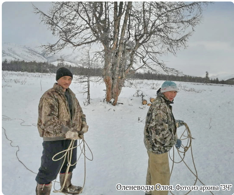
Оленеводы Олая.

Елтэнчэч билэкэл гургэвчимгэлтэн инэнэндын хокамкаттап! Эйдулин аймакан не-кэбдэн хунду, абгаргасан, дюлитту! Оралсан хоялбадасан нескэсэн-дэ индүлэсэн!