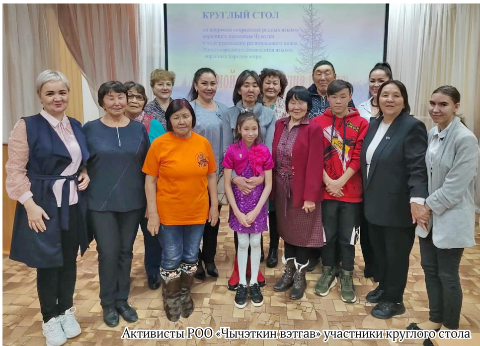
Активисты РОО «Чычеткин вэтгав» участники круглого стола

русских писателей. Однако эти экземпляры требуют не только переиздания, но и своего читателя. Основной акцент работы библиотеки по краеведению ставится на общение с современными детьми и молодёжью. А так как нынешняя молодёжь почти не знает родного языка, то и литература на чукотском, эвенском и других языках автоматически становится невостребованной, но всё же книга ждёт своего читателя. Необходимо создавать реальные условия для первоначального обучения детей на их родном языке в дошкольном возрасте и в начальной школе, по возможности сохраняя родной язык в семье. В свою очередь, библиотеки района всегда готовы предоставить доступ к краеведческому фонду любому человеку, желающему познакомиться или изучить жизненный уклад нашего народа. Библиотека продолжит пополнять библиофонд, оказывать поддержку в популяризации языков КМНЧ, а также сохранять родной язык в печати.