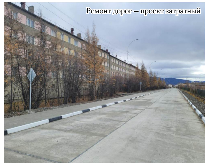
Ремонт дорог — проект затратный

Нарекания по высоким бордюрам или неверным переходам принимаю, будем стараться исправлять. Не всё делается, как задумано, но потихоньку движемся, делаем. Конечно, не без ошибок. Дом по улице Курчатова освежили весёлой картинкой, но прошло время и получили то, что видим сейчас. Теперь знаем, что надо красить только панельные дома. А технология обшивки зданий металлокассетами блочных домов – хороший проект. Получается красиво и аккуратно.