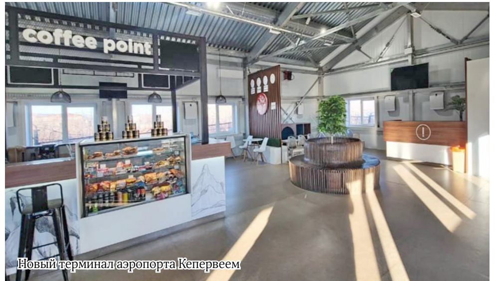
Новый терминал аэропорта Кепервеем

Раз уж речь зашла о новой организации самоуправления – муниципальном округе, то поясню. Значительно проще будет работать. Как правило, к концу года в бюджете появляются какие-то средства, состоящие из сэкономленных на торгах или неосвоенных средств. Чтобы эти деньги были в обороте, их надо перекинуть на какие-то другие, более горячие темы. Но сейчас это путь бесконечных сессий. По регламенту районный Совет депутатов пишет ходатайство, далее созывается сессия, на которой депутаты рассматривают причину: «почему? зачем?». Потом мероприятие проходит в селе с участием сельских депутатов, оттуда приходит решение. Вновь собирается сессия и, наконец, начинаются бюджетные передвижки. Оперативно это делать не получается. Если будет