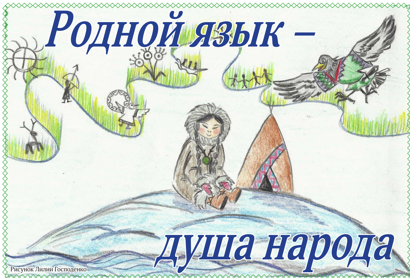
Рисунок Лилии Господенко

№ 45 (5918) 18 ноября 2022 года. Издательство «Крайний Север» — Билибино. Издаётся с 13 августа 1965 г. Цена в розницу свободная. Мы ждём ваших новостей по тел.: 2-63-93 bilibino@ks.chukotka.ru