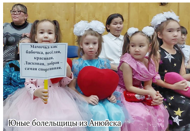
Юные болельщицы из Анюйска