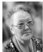
Автор текстов и перевода Ульяна ТАРАБУКИНА