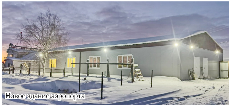
Новое здание аэропорта

На прошлой неделе глава муниципального образования Билибинский муниципальный район Евгений Сафонов посетил с рабочей поездкой самое отдалённое сельское поселение Омолон.