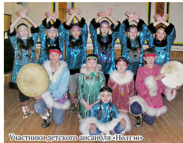
Участники детского ансамбля «Нэлтэн»

Сейчас я учусь в средней школе города Билибино и посещаю класс «Гитары» в Билибинской школе искусств. В памяти моей живы мелодии, которые напевала мне бабушка. Надеюсь, что я освою музыкальную грамоту, положу все бабушкины мелодии на нотный стан. Я хочу воплотить свою мечту в жизнь, чтобы память о моей бабушке, представительнице малочисленного северного народа, принадлежностью к которому я горжусь, была жива.