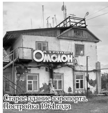
Старое здание аэропорта. Постройка 1964 года