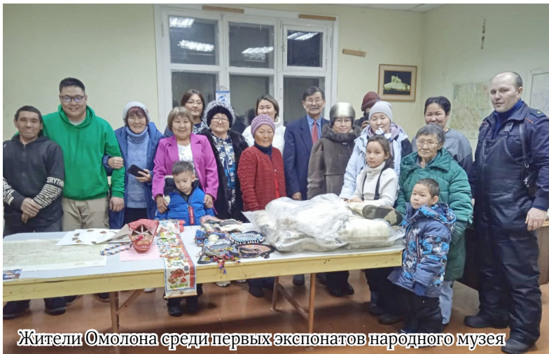
Жители Омолона среди первых экспонатов народного музея

Тачин-да некэнмэйдү илкуптин ДК төлдэлэн этноцентру хэектив эвэдыв-дэ дюлбу илүбгарадан, нунмерэл мэрдыюр хэбдекэдекэлбур хэбдеккэрэдэ-тэн, некэнмэйлбур-дэ ичүкэчидгэрэдэ-тэн. Эрэк илупча площадка анчиндулан көчүкэн дендрарий хякиталкар, хятака-галкан исагалкан-мэенидэли хевэттилдук.