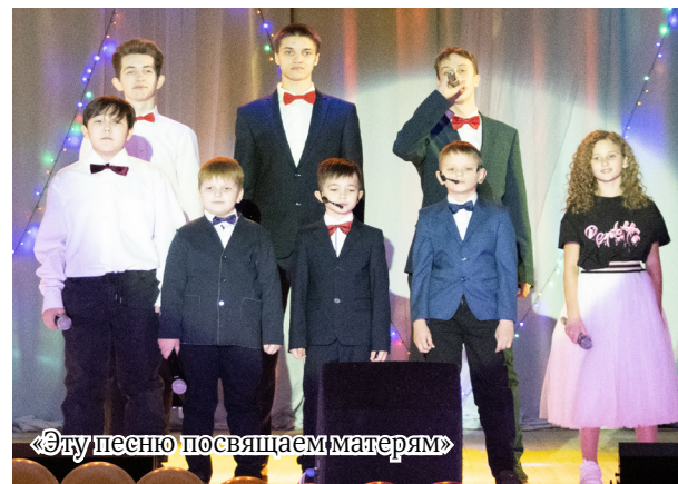
«Эту песню посвящаем матерям»