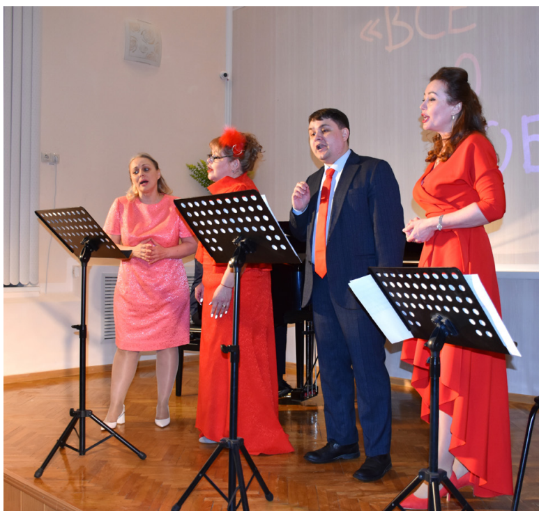
Застольная песня из оперы «Травиата»