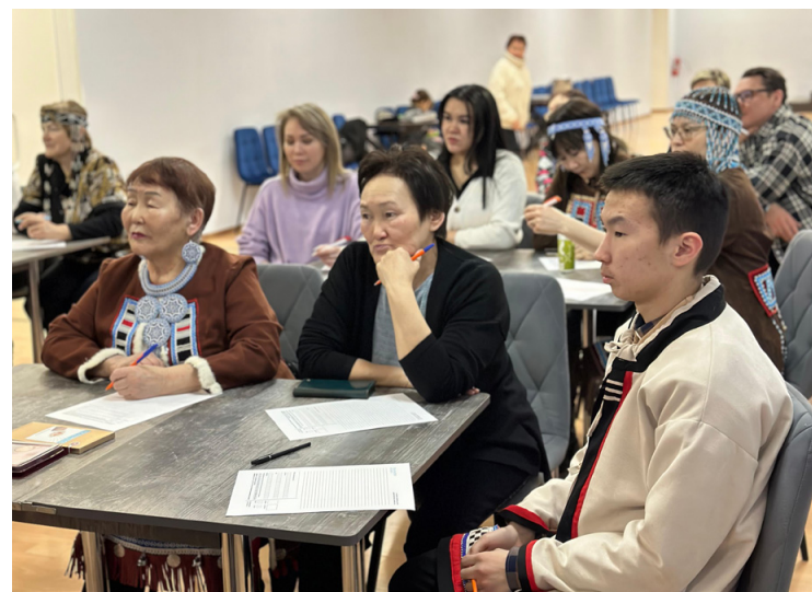
Многие пожелали проверить свои знания по эвенскому языку

После завершения диктанта состоялось обсуждение, где участники могли