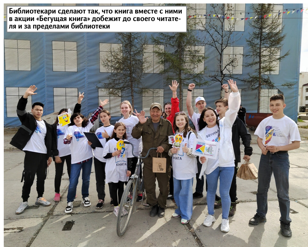
Библиотекари сделают так, что книга вместе с ними в акции «Бегущая книга» добежит до своего читателя и за пределами библиотеки

лей. Книжный фонд на любой читательский вкус насчитывает более 100 тысяч экземпляров книг. При этом, библиотека славится не только своими высокими показателями в работе, но и активным молодым персоналом, активным участием в культурной жизни района. Она регулярно открывает свои двери для культурных, деловых, просветительских встреч,