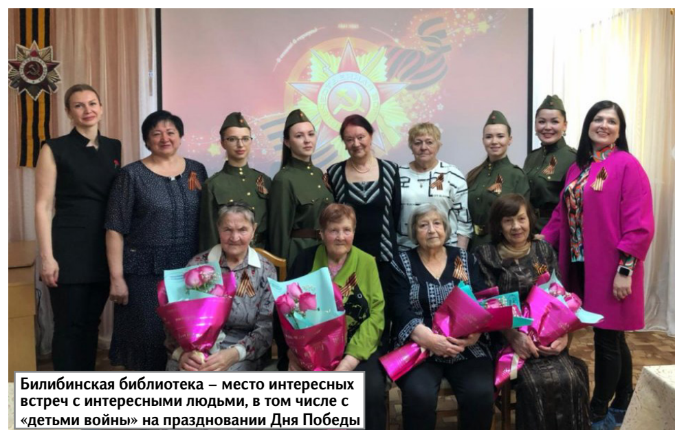
Билибинская библиотека – место интересных встреч с интересными людьми, в том числе с «детьми войны» на праздновании Дня Победы

Время неумолимо бежит вперед и за 65 лет в библиотеке произошли большие перемены. Сегодня это современная библиотека, оснащенная специализированной мебелью, необходимой техникой, что создает уют и комфорт для читате-