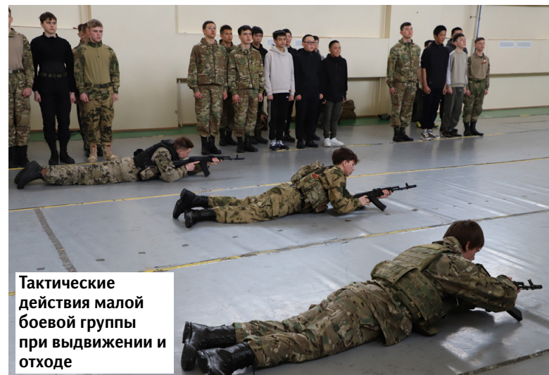
Тактические действия малой боевой группы при выдвижении и отходе

Все наставники отмечают высокий уровень подготовки многих ребят. Особенно тех, кто занимается в военно-патриотических клубах. Не зря почти все звания лучших в пяти номинациях получили призёры прошедшей недавно окружной военно-спортивной игры «Зарница-2025».