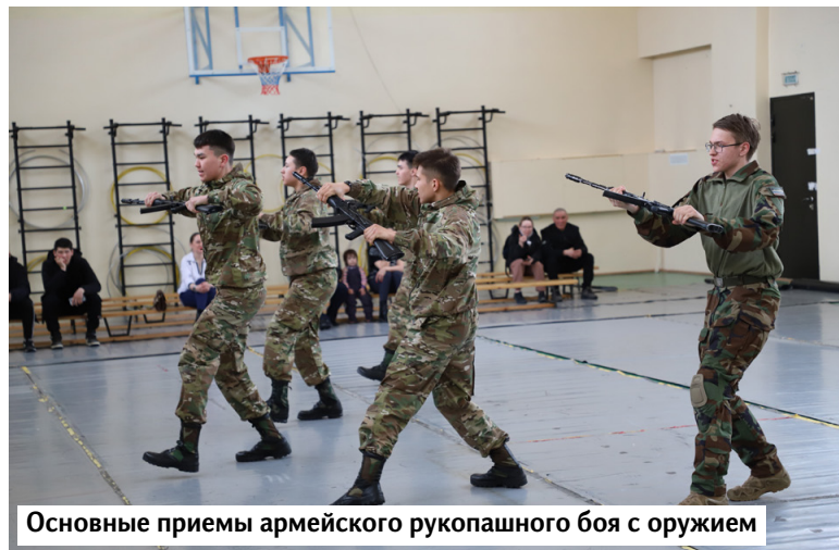
Основные приемы армейского рукопашного боя с оружием

Никакая другая форма образования и воспитания не гарантирует столь тесной взаимосвязи получаемых теоретических знаний и формируемых умений и навыков их практического использования, как учебные сборы.