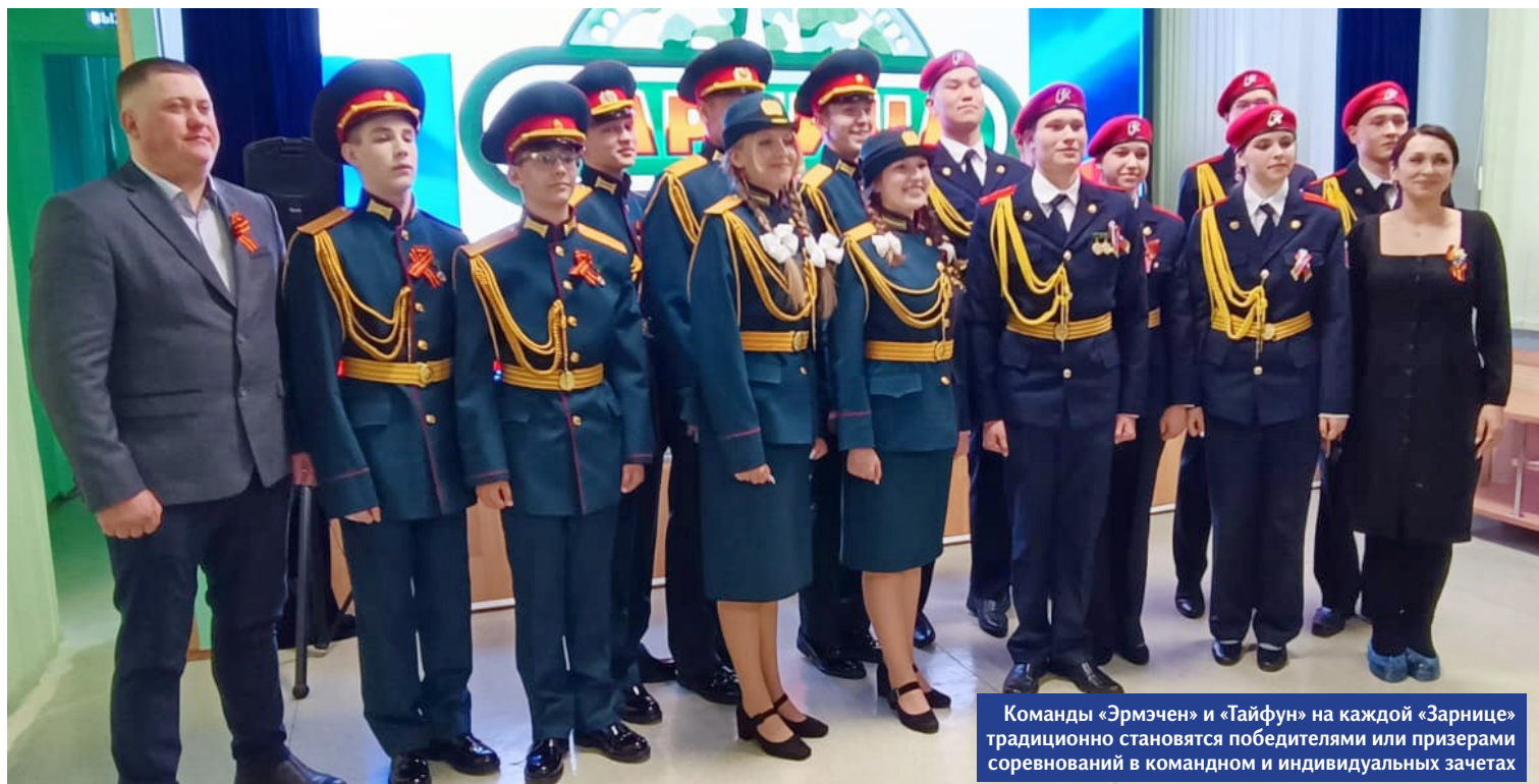
Команды «Эрмэчен» и «Тайфун» на каждой «Зарнице» традиционно становятся победителями или призерами соревнований в командном и индивидуальных зачетах

В четверг 24 апреля в Билибинском краеведческом музее имени Г.С.Глазырина состоялось награждение призёров окружного финала военно-спортивной игры «Зарница-2025». Это команды «Тайфун» Чукотского северо-западного техникума и «Эрмэчен» Билибинской общеобразовательной школы, представившие наш город на ежегодном окружном военно-патриотическом состязании.