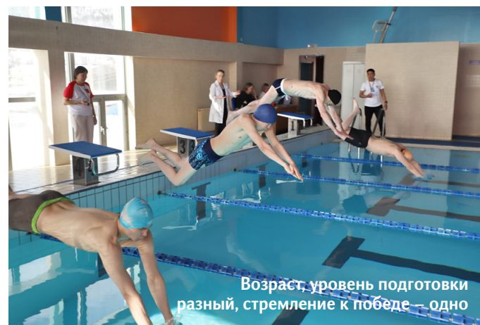
Возраст, уровень подготовки разный, стремление к победе — одно

Одиннадцать заплывов совершили участники, а первыми на старт вышли семнадцать воспитанников