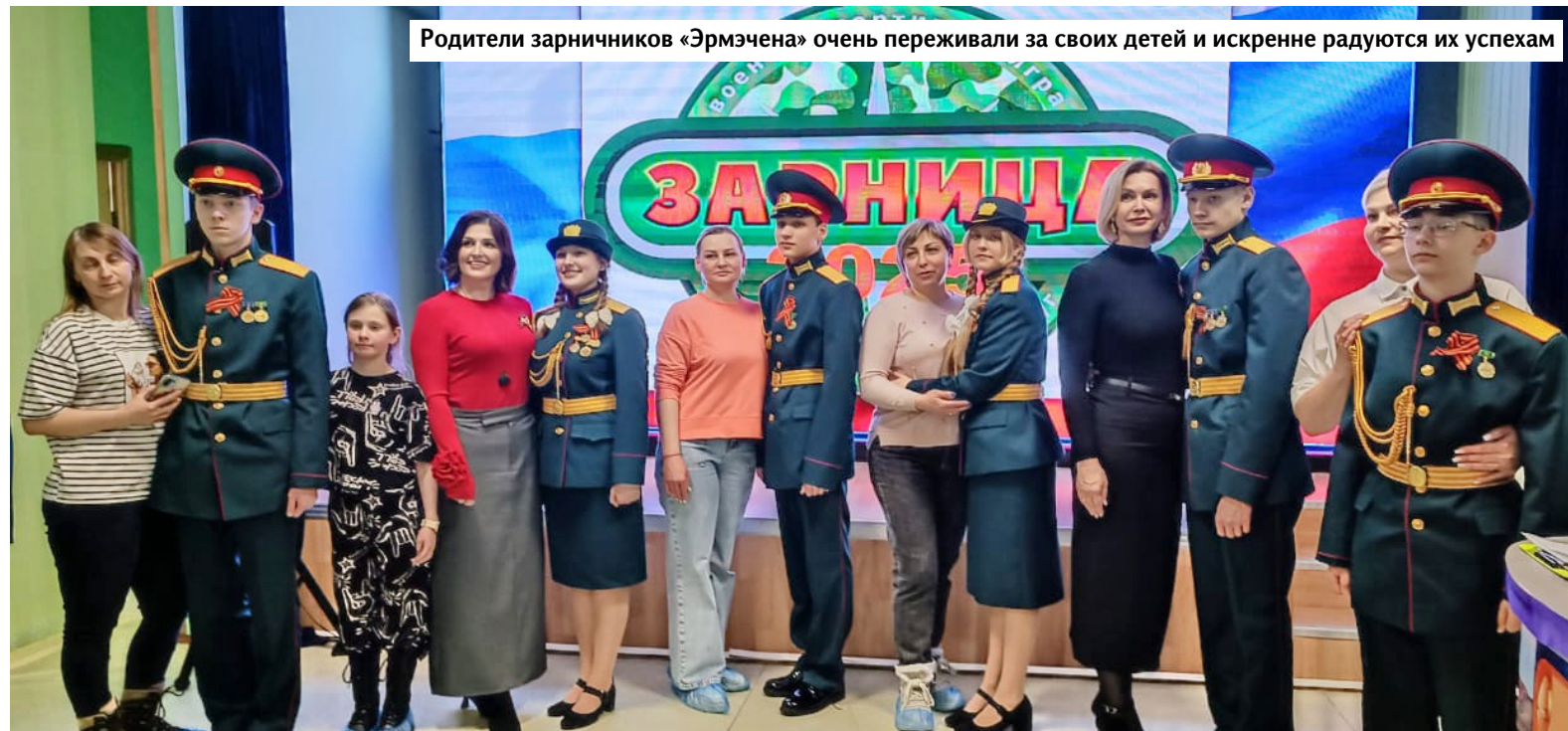
Родители зарничников «Эрмэчена» очень переживали за своих детей и искренне радуются их успехам