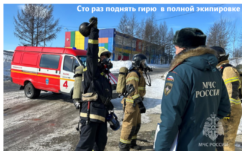
Сто раз поднять гирю в полной экипировке

Все испытания строго контролировались судейской коллегией с учётом временных показателей и возможных ошибок при их выполнении.