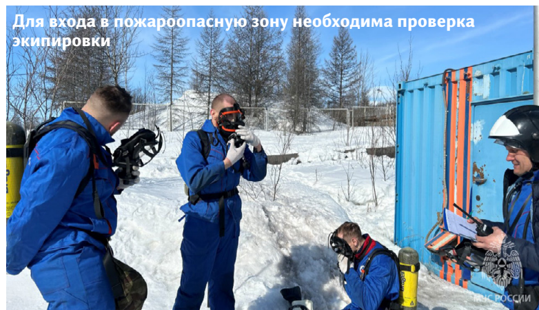
Для входа в пожароопасную зону необходима проверка экипировки