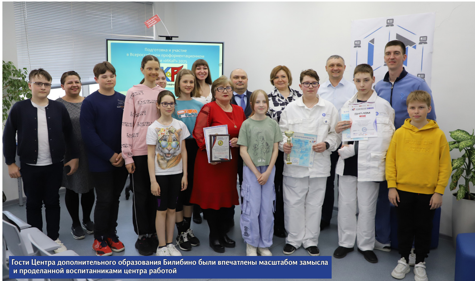
Гости Центра дополнительного образования Билибино были впечатлены масштабом замысла и проделанной воспитанниками центра работой

Ребята подсчитали, что для вывоза такого количества ядерного топлива потребуется осуществить более 30 тыс операций. При посещении атомной станции они выяснили, что автоматизированная система выгрузки топлива там отсутствует и решили разработать свою автоматизированную систему. «Чукотские механики» даже