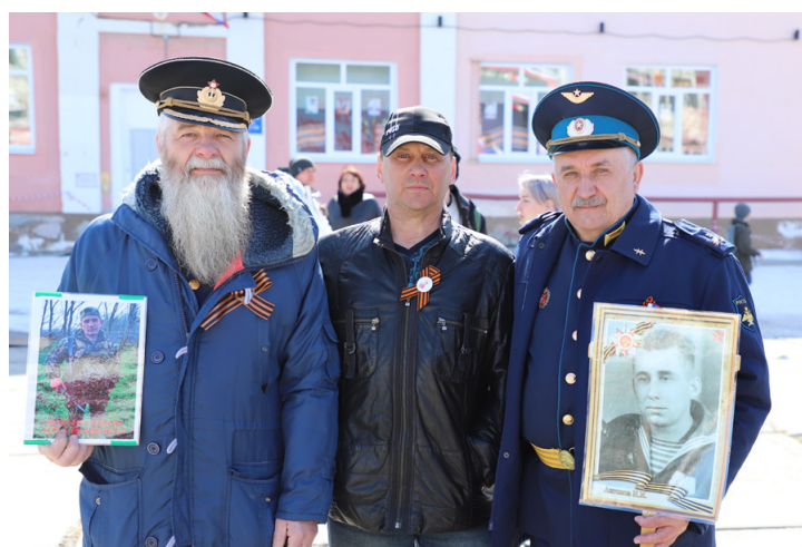
Билибинцы вместе со своими родными – героями прошли маршем и праздновали на площади 80-летие Победы Читайте на стр. 3

№ 19 (6045) 16 мая 2025 года. Издательство «Крайний Север» — Билибино. Издаётся с 13 августа 1965 г. Цена в розницу свободная. Мы ждём ваших новостей по тел.: 2-63-93 bilibino@ks.chukotka.ru