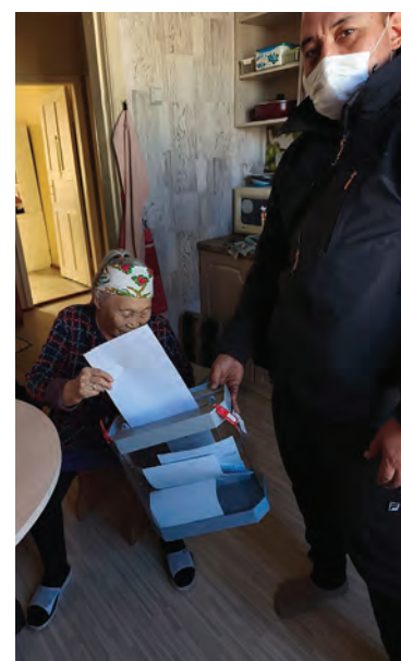
Избирательная комиссия обеспе- чила комфорт и все требования законодательства для голосо- вания маломобильных граждан по месту жительства в с. Омолон