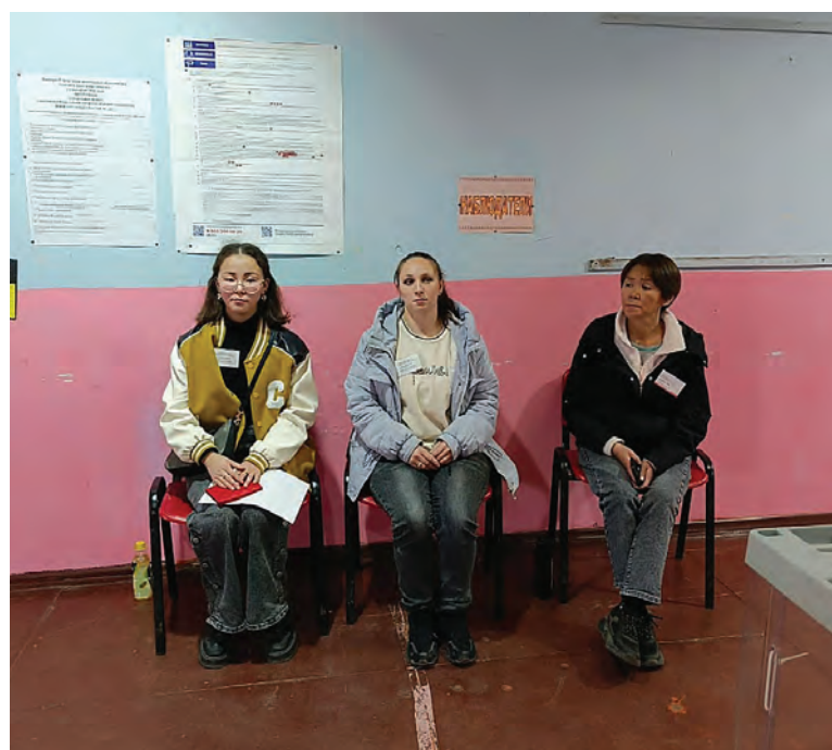
Прозрачность на выборах в Омолоне обеспечивали наблюдатели от общественности