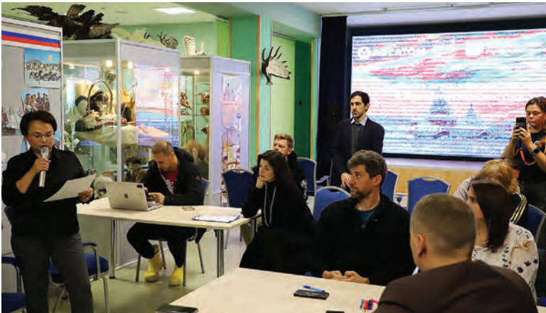
Представители команд пошагово рассказали, как бы они организовали туристический тур

Интересно, что одним из результатов исследований экспертами от Росатома стало открытие о бедном ассортименте национальных блюд из местных продуктов. Из зала прозвучали возражения, но этот пример показал, почему нужен туризм – разделить общее счастье и гордость за свою землю с другими, найти что-то новое и поделиться этим с другими.