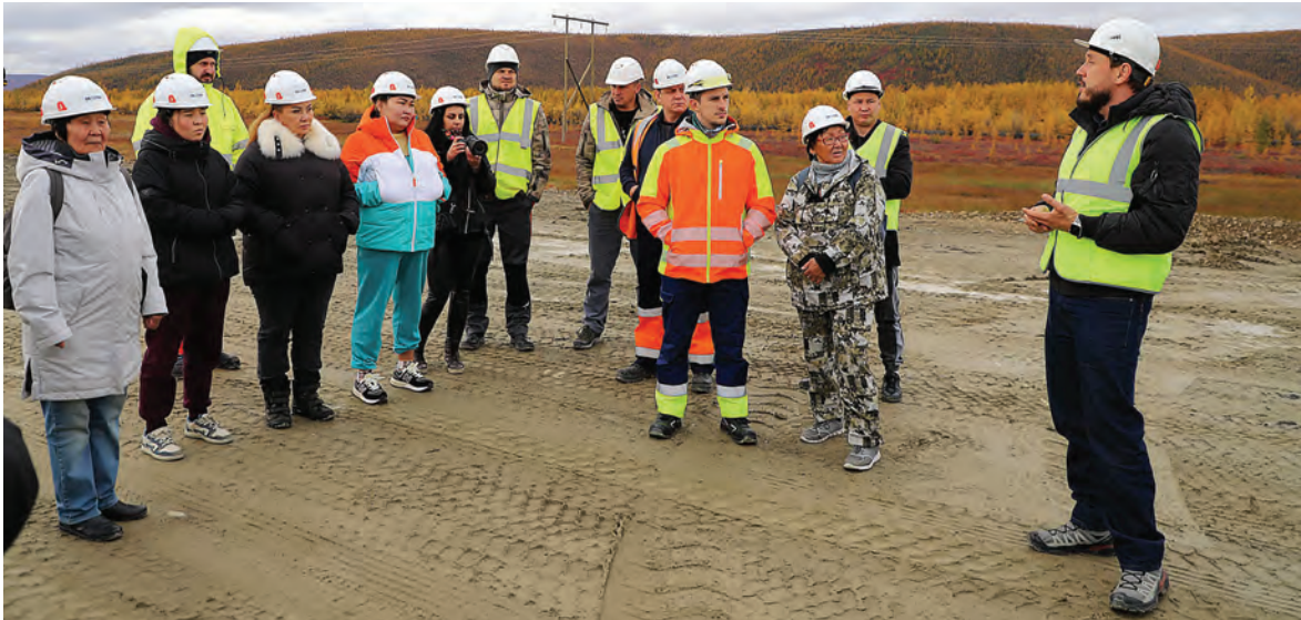
Делегация общественности Билибинского района и представители компании «Баимская», её подрядных организаций на месте строительства участка автодороги Песчанка – Билибино – Наглейный возле места съезда к одному из карьеров, где уже работает техника

Протяженность автодороги северной и южной её части составит более 205 км, строителям предстоит возвести семь мостов, два из которых большие. Для строительства предусмотрено ис-