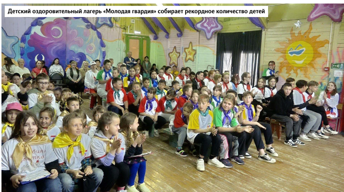
Детский оздоровительный лагерь «Молодая гвардия» собирает рекордное количество детей

ДНИ ЧУКОТСКОГО АВТОНОМНОГО ОКРУГА В СОВЕТЕ ФЕДЕРАЦИИ ЗАВЕРШИЛИСЬ ПРЕЗЕНТАЦИЕЙ РЕГИОНА И ПЛЕНАРНЫМ ЗАСЕДАНИЕМ