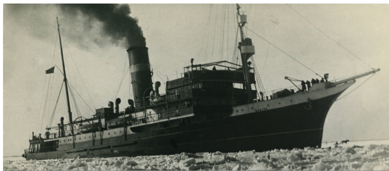
«Фёдор Литке» потратил на преодоление Севморпути чуть более двух месяцев побив все рекорды того времени, но сейчас время пути по этому маршруту составляет не более двух недель