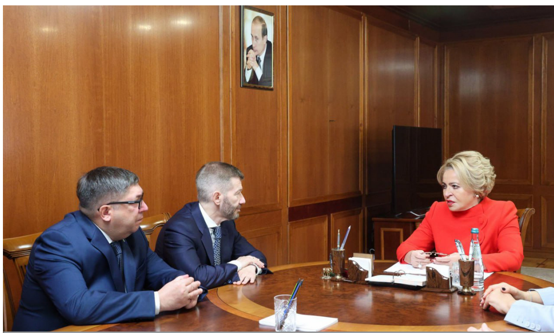
Спикер Совета Федерации Валентина Матвиенко на встрече с губернатором Владиславом Кузнецовым обозначила особое стратегическое значение Чукотского автономного округа в современных условиях и предложила возможные меры федеральной поддержки региона

В завершении обсуждения Валентина Матвиенко отметила, что регион развивается, реализуются новые проекты, несмотря на суровые арктические условия,