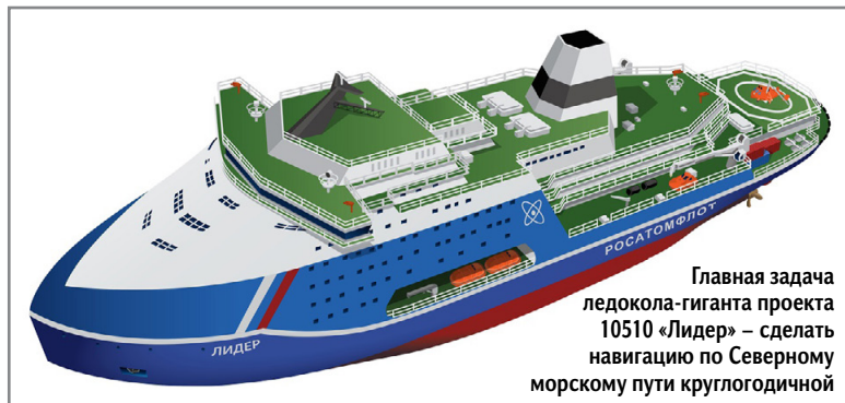
Главная задача ледокола-гиганта проекта 10510 «Лидер» – сделать навигацию по Северному морскому пути круглогодичной

ОТ «ЛЕНИНА» до «ЛИДЕРА» В 2020 году началось строительство атомного ледокола «Россия» (проект 10510 «Лидер»). Он станет самым мощным в мире атомным ледоколом (120 МВт). Энергию судно получает из двух реакторных устано-