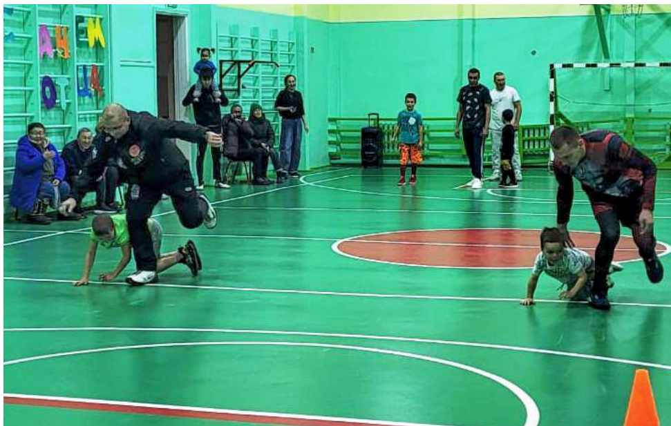
Весело и задорно отметили День отца в Илирнее