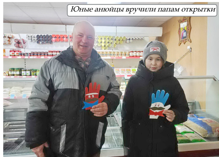
Юные анюйцы вручили папам открытки