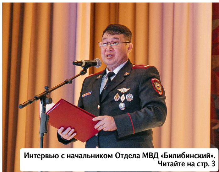
Интервью с начальником Отдела МВД «Билибинский». Читайте на стр. 3

№ 45 (6071) 14 ноября 2025 года. Издательство «Крайний Север» — Билибино. Издаётся с 13 августа 1965 г. Цена в розницу свободная. Мы ждём ваших новостей по тел.: 2-63-93 bilibino@ks.chukotka.ru