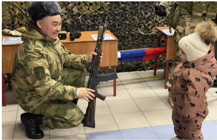
Главными гидами на выставке стали папы-военнослужащие. Ребята с интересом смотрели и слушали как они управляются с оружием и специальными техническими средствами