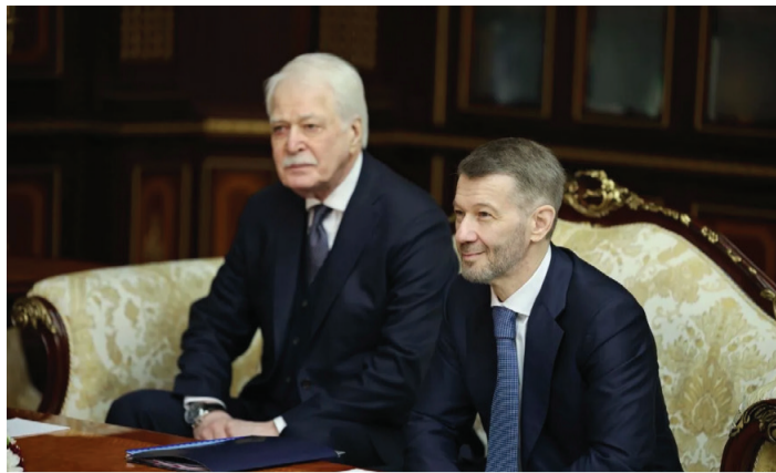
О РАБОЧЕЙ ПОЕЗДКЕ ГУБЕРНАТОРА ВЛАДИСЛАВА КУЗНЕЦОВА В БЕЛАРУСЬ .....стр. 2

№ 12 (6090) 03 апреля 2026 года. Издательство «Крайний Север» — Билибино. Издаётся с 13 августа 1965 г. Цена в розницу свободная. Мы ждем ваших новостей по тел.: 2-63-93 bilibino@ks.chukotka.ru