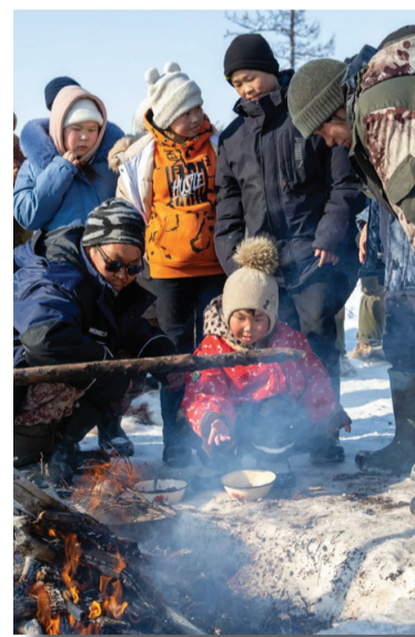
В традиционных для народов Чукотки обрядах принимали участие не только взрослые, но и дети. Пользуясь возможностью, старожилы с радостью делились опытом с подрастающим поколением